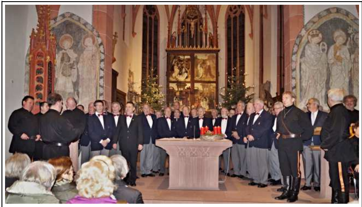
Weihnachtliches Konzert 2015 mit Peter Orloff und den Schwarzmeerkosaken