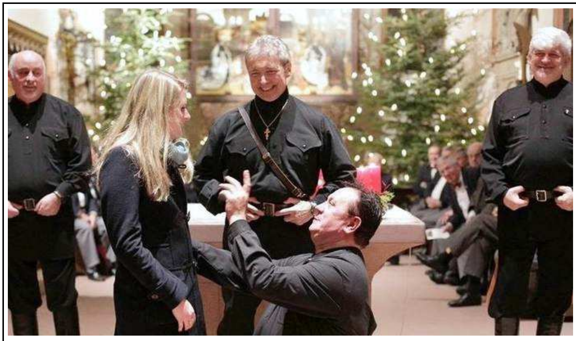
Zu Scherzen aufgelegt zeigten sich die Schwarzmeerkosaken: Ein Sänger führt eine junge Zuhörerinnen vor den Altar

Eine ganze Reihe von russischen Volksliedern und Balladen erinnerten an ein winterlich verschneites Russland. Jeder der einzelnen Sänger glänzte mit Soloauftritten und bekam den gebührenden Applaus. Dabei zeigten die stimmgewaltigen Männer mit kleinen Scherzen am Rande auch ihre humorvolle Seite. Eine junge, blonde Frau aus dem Publikum bekam das besonders zu spüren und wurde von einem der Sänger vor den Altar geführt.