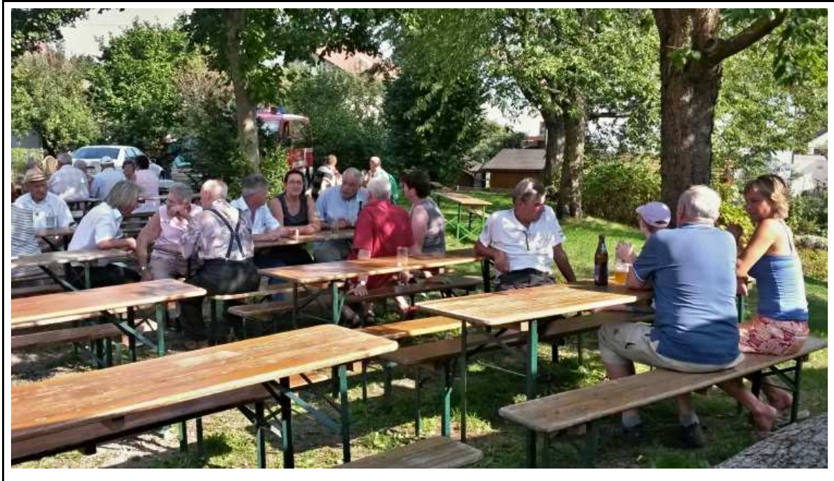
Weißwurstfrühstück am 30.August 2015, bei über 30° im Schatten