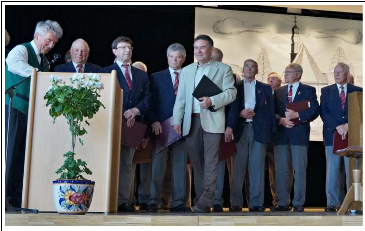
Auftritt beim Sängerefest in Schellbronn am 26. April 2015 (M. Dietrich)