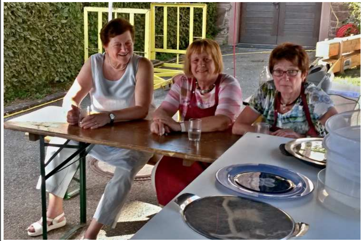
Ohne fleissige Helfer ist kein Fest möglich (R.Bantscheff):