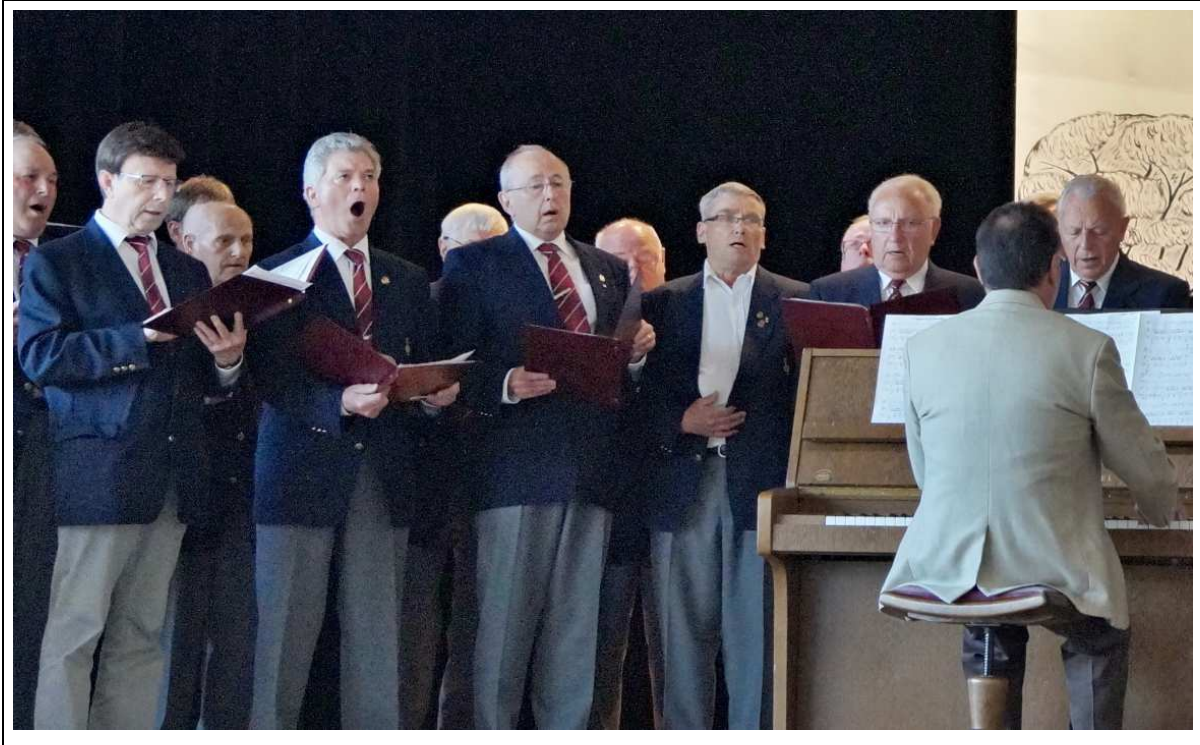
Auftritt in Schellbronn am 26. April 2015 (von Manfred Dietrich), beide Fotos dieser Seite