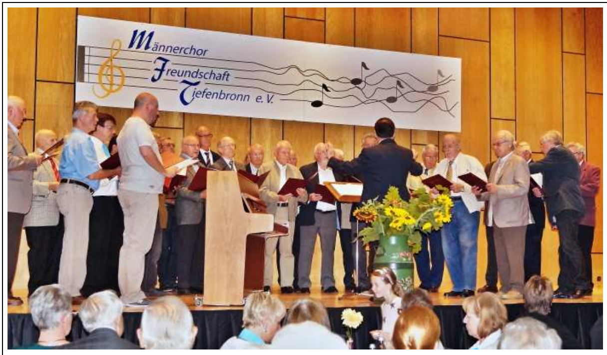
Begrüßung der anwesenden Vereine mit einem Lied unseres Chors