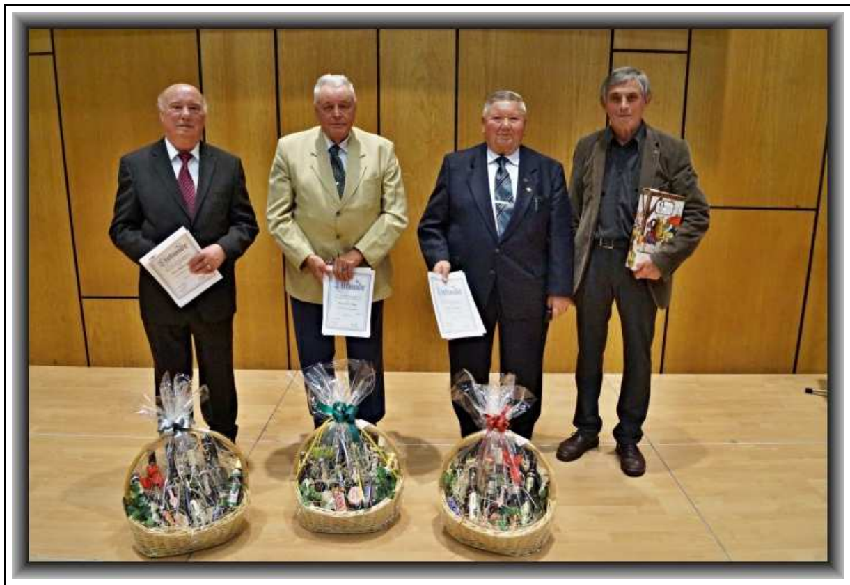
Die geehrten Sänger an diesem Abend :